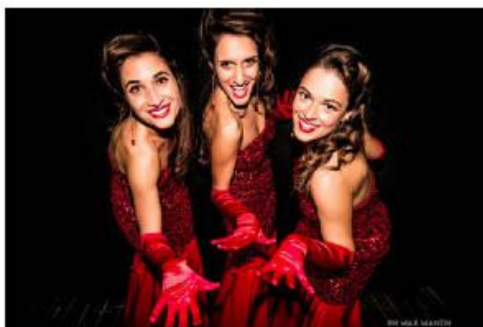
Les Babettes

dove Politeama Rossetti, Largo Gaber, Trieste (TS)