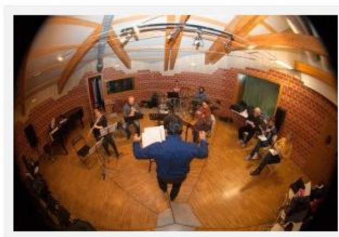
Prove d'orchestra

Per le sue caratteristiche strutturali – alternanza di canto e recitazione, vivacità, immediatezza – Malinteso Tergestino ricorda in tutto e per tutto l'operetta. "Ma oggi – spiegano gli ideatori dello spettacolo – non si ride più tanto per ciò che faceva ridere a fine Ottocento, e non sempre bastano le note di un valzer per sentirsi rapiti dalla musica. Oggi lo spirito allegro e brillante dell'operetta, per divertire e sorprendere, ha bisogno di reincarnarsi e rinascere in una forma giovane, fresca e ironica. Con questo proposito lanciamo questo spettacolo, che ci piace definire la prima operetta 2.0".