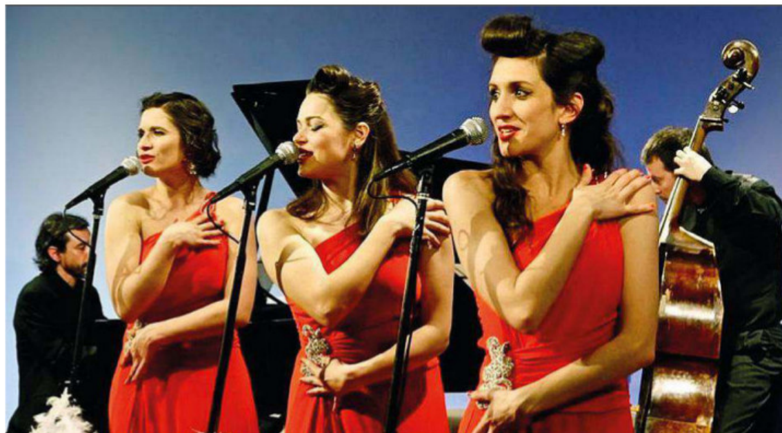
Ci saranno anche Les Babettes a "Buon anno Trieste", lo spettacolo del 5 gennaio organizzato dall'Associazione commercianti al dettaglio al Rossetti