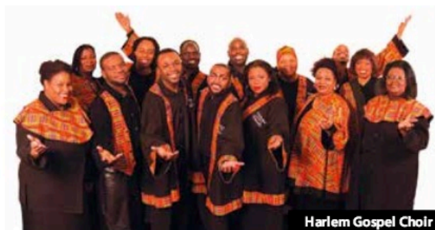
Harlem Gospel Choir